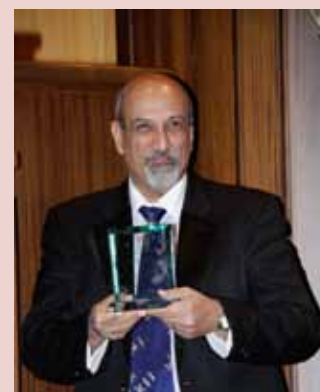
Prof. Salim Abdool Karim